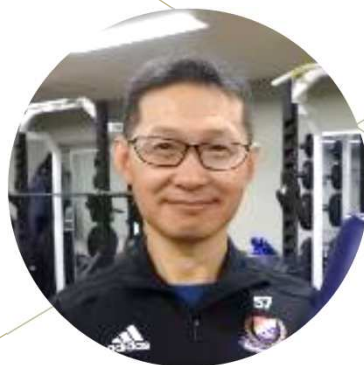
名誉理事 ストレッチポール開発者・ 体育Iを日本一にした監督